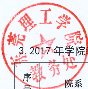
3. 2017年学院教研项目申报与验收情况一览表