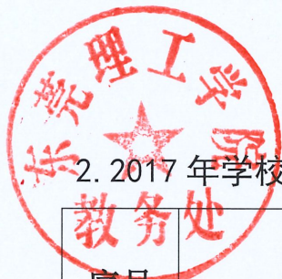
2. 2017 年学校项目结题与验收情况一览表