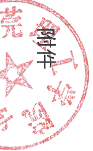
2017 年度校级课建设项目立项一览表